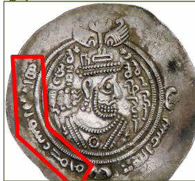
Première mention à Mahomet apparaissant dans l'histoire (685-686), sur une pièce frappée à l'effigie d'un opposant au pouvoir califal.

S'est alors ouverte une terrible période de guerre civile , où les Arabes ont cherché une justification religieuse à leurs prétentions au pouvoir et à leur conviction rémanente d'avoir été choisis par Dieu pour dominer la terre entière. Des oppositions entre factions, du jeu de surenchère auquel elles se sont livrées pour rivaliser de légitimité religieuse, sont nés les premiers concepts de l'islam :