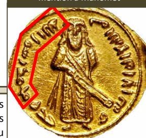
Pièce frappée à l'effigie d'Abd Al Malik (696), avec reprise de la mention à Mahomet

Le Coran , constitué à partir des écrits de prédication des judéonazaréens à destination des Arabes, a été peaufiné par les scribes sous l'autorité des califes : il a été adapté à partir du malléable squelette consonantique (sans diacritisme, c'est-à-dire sans les accents permettant de distinguer les consonnes entre elles), légué par les premières « collectes du Coran », à mesure que se formait le discours canonique des origines obligeant précisément à l'interpréter. Dans une logique de cercle vicieux , le texte coranique a été lu et manipulé en fonction de ce qu'exigeaient les traditions fabriquées qui, elles-mêmes, voulaient s'appuyer sur le Coran. C'est ainsi qu'on a été établies les traditions musulmanes : la première biographie normalisée du « Prophète », la Sîra , composée au 9 e siècle, soit 200 ans après les faits supposés (tous les écrits antérieurs ayant été détruits), les recueils de hadiths (ou dires de Mahomet complétant la révélation coranique), l'histoire sainte des premiers califes validant la conservation inaltérée du Coran, et d'autres écrits exaltant les conquêtes, rédigés sous l'autorité absolue des califes de Bagdad, qui y trouvaient la justification de leur pouvoir et de leur conduite , calquée sur celle prêtée à Mahomet.