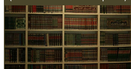
Bibliothèque de hadiths ; on en compte plus d'un million et demi (dont 20 000 « authentiques »)

Cette période de l'établissement de l'islam a marqué l'histoire par la constante opposition de factions autour de la formation d'une religion qui constituait la clé de l'exercice du pouvoir : oppositions entre sunnites et chiites, partisans et opposants des nouveautés introduites par les califes, partisans d'un « Coran créé » et d'un « Coran incréé », écoles juridiques issues des diverses interprétations du texte normatif du Coran et des jurisprudences qui en ont découlé ... Devant les dangers pour la cohésion de l'empire, le pouvoir califal a décidé l' arrêt de l'effort d'interprétation de la religion à la fin du 10 e siècle, ce qui en a figé les contours dans les modalités que nous voyons toujours aujourd'hui. Depuis, l'opposition entre musulmans s'est perpétuellement poursuivie, mais une certaine unité s'est toujours formée lorsque le projet messianiste était en jeu, que ce soit pour aller envahir des territoires nouveaux, défendre l'intégrité de l'islam, ou pour mater les révoltes des esclaves et des populations non-musulmanes « soumises ».