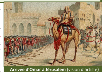
Arrivée d'Omar à Jérusalem (vision d'artiste)

Jérusalem a été prise par les Arabes conduits par les judéonazaréens. Malgré la reconstruction du Temple, selon les témoignages contemporains (le pèlerin Arculf, le patriarche Sophrone), et le rétablissement du culte et des sacrifices, le « Messie Jésus » n'est pas revenu . Les Arabes se sont alors retournés contre leurs maîtres en religion, ont massacré les chefs et banni les autres. La condamnation des judéonazaréens est allée jusqu'à chercher à détruire toute trace de leur influence auprès des Arabes, jusqu'à la destruction de leurs textes religieux (Torah, Evangile, et lectionnaire – ou « coran » en arabe), jusqu'à l'effacement même du nom qu'ils portaient ( nasârâ , nazaréens en arabe) qui a été détourné de son sens premier pour désigner d'office les chrétiens.