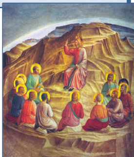
Le sermon sur la montagne (de Fra Angelico)

Du point de vue de l'histoire des idées, la possibilité d'un salut , nouveauté spirituelle et philosophique absolument radicale prêchée par Jésus et ses apôtres, a transformé en profondeur la perception du destin collectif : il est devenu possible d'envisager une société et un monde délivrés du mal. Face au scandale des injustes qui prospèrent et du mal qui sévit partout, cette conviction nouvelle se prêtait à être dévoyée . Autour de la communauté judéochrétienne première de Jérusalem, certains n'ont pas accepté que le messie attendu par le peuple hébreu puisse se faire serviteur et mourir crucifié. Bien que vénérant Jésus, ils ont réinterprété son enseignement et sa promesse de sauver le monde selon leur lecture des prophéties bibliques (Livre d'Isaïe, et particulièrement Livre de Daniel) : promesse du rétablissement de la royauté en Israël, de sa suprématie à venir sur les nations, telle que les méchants et les injustes seraient vaincus et que le mal serait banni de la terre. Selon ces messianistes , que les historiens ont appelé « judéonazaréens », Jésus aurait dû réaliser ce programme de son vivant mais en avait été empêché par la corruption d'Israël et de ses prêtres, par le dévoiement de la religion et par l'impureté du Temple : Dieu avait alors enlevé Jésus au ciel avant la crucifixion en attendant que des circonstances plus favorables permettent son retour et la réalisation des prophéties.