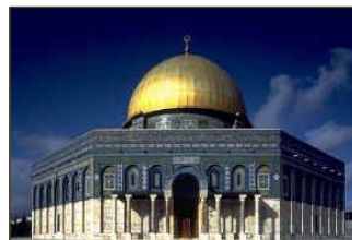
Le Dôme du Rocher, construit à Jérusalem sur l'ancien emplacement du Temple vers 692

C'était le sens de la construction du Dôme du Rocher (vers 692) et de ses inscriptions affirmant le prophétisme de Mahomet. Les califes successeurs ont alors fait composer et structurer la théologie islamique, le récit légendaire de l'apparition de l'islam et de la figure prophétique de Mahomet . C'est ainsi qu'ils ont justifié leur domination politique totale, jusqu'à la reprise du nom d'islam (« soumission », terme apparaissant au 8 e siècle) pour