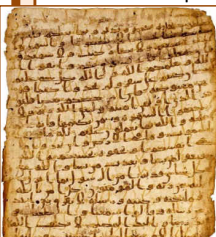
Manuscrit coranique sans diacritisme (fin 7 e siècle), conservé à Copenhague

recherches sur les origines du christianisme et sur ses manuscrits. Les nouvelles technologies permettent non seulement des études inédites (par exemple l'analyse informatique systématique du texte coranique) mais surtout la mise en réseau de chercheurs issus des domaines les plus variés – histoire, numismatique, archéologie, exégèse, philologie, paléographie, linguistique ... Ainsi, alors que les découvertes de témoignages historiques non conformes à l'historiographie classique se sont multipliées, des analyses nouvelles ont ébranlé les dogmes islamologiques, notamment grâce à Patricia Crone, Alfred-Louis de Prémare, Günter Lüling, précurseur des travaux de Christoph Luxenberg, Claude Gilliot, etc.